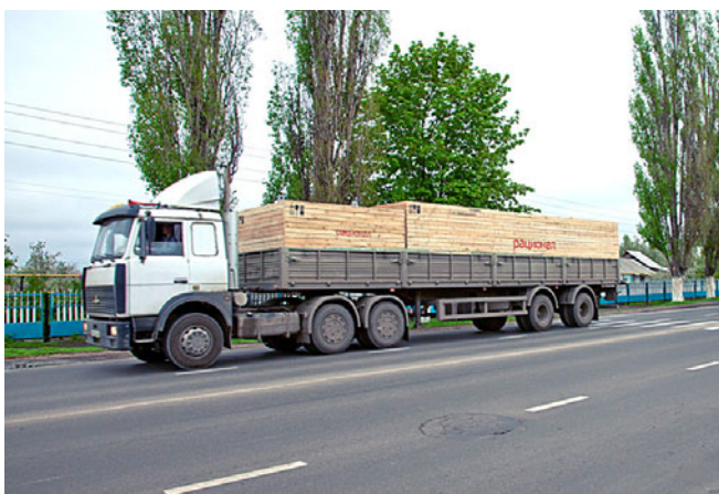
Дымовые трубы котельной РАЦИОНАЛ, упакованные в деревянную тару

Котельная РАЦИОНАЛ изготовлена по заказу ТОО «Теплосвет КЗ», для собственных нужд университета, строительство и развитие которого продолжается и в настоящее время: в 2010 году был