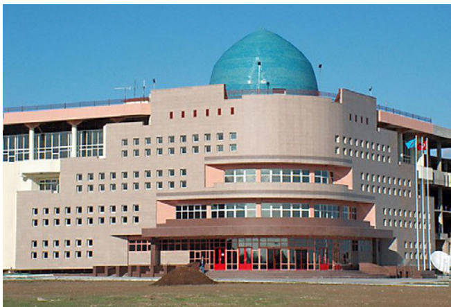
Международный казахско-турецкий университет им. X. А. Ясави

общежития для студентов, ботанический сад. Вуз располагает собственной клиникой на 60 мест. Туркестанский клинично-диагностический центр оборудован всей необходимой аппаратурой, приобретенной в Турции.