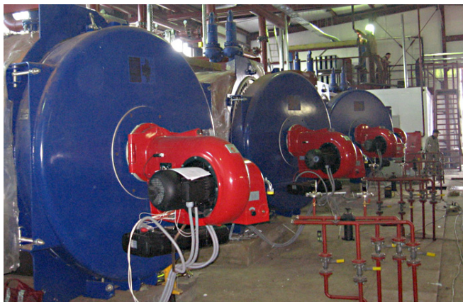
Новая котельная в пос. Ванавара Красноярского края с горелками Weishaupt RMS 11 и RMS 70

После взрыва в Ванаваре сразу объявили чрезвычайное положение, край мобилизовал все