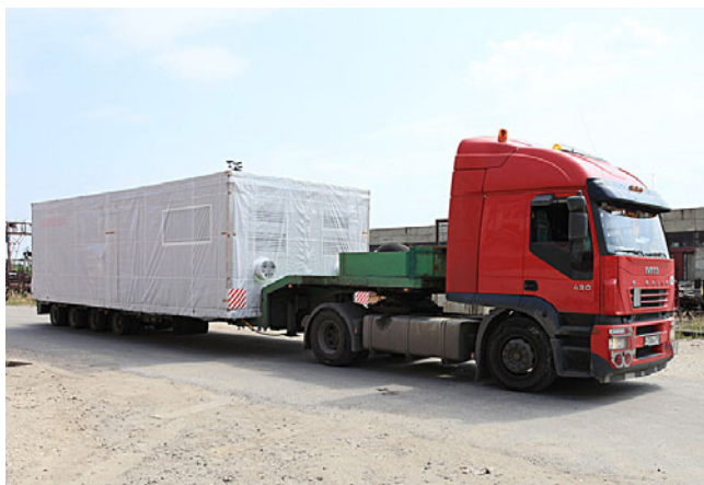
Поставка газовой котельной РАЦИОНАЛ ЕСО 20 для завода «ТИКО-Пластик»

Основными аргументом выбора котельной в узловом исполнении стало удобство транспортировки и монтажа, поскольку по проекту котельная была запланирована на крыше торгового центра.