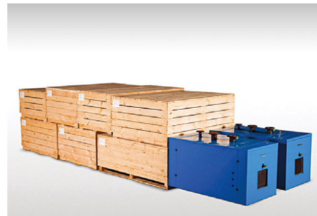
Котельная РАЦИОНАЛ серии ЕСО в узловом исполнении

Котельная для ТЦ Созвездие смонтирована и запущена в августе 2011 года также компанией СК «Спецмонтаж НН». ■