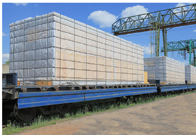
Для перевозки ж/д транспортом в конструкции котельной предусмотрена возможность крепления модуля к платформе

Для всех котельных РАЦИОНАЛ, поставляемых в страны СНГ предоставляются сертификаты соответствия котельных и разрешение на применение котельных в соответствующей стране. ■