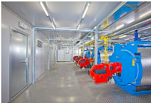
Котельная РАЦИОНАЛ 10 000 ЭКО 2 для перинатального центра в г. Владивосток

Свою лепту в развитие качества обслуживания жителей Дальнего Востока внесла и компания РАЦИОНАЛ, изготовив для реализации государственного контракта по строительству перинатального центра котельную РАЦИОНАЛ 10 000 ЭКО 2 суммарной мощностью 10 МВт по технологии UNI на базе котлов Buderus. Котельная произведена по передовым европейским технологиям проектирования и производства с использованием оборудования лучших европейских марок. Завершение строительства центра планируется до конца 2013 года. ■