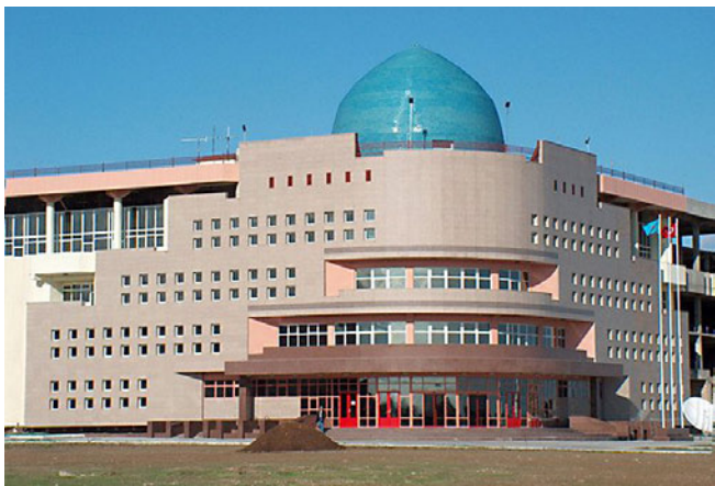
Международный казахско-турецкий университет им. Х. А. Ясави

общежития для студентов, ботанический сад. Вуз располагает собственной клиникой на 60 мест. Туркестанский клинично-диагностический центр оборудован всей необходимой аппаратурой, приобретенной в Турции.